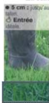
Mise à l'herbe