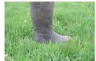
Hauteur de talon de botte