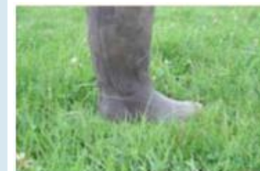
Repère 5 cms herbomètre