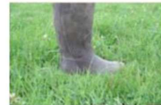
Repère 5 cms herbomètre

Définir sa durée (temps de retour) : à partir du repère de 300°C, si une majorité des parcelles est à fort potentiel de pousse ou à démarrage précoce, un temps de retour à 25/30 jours sera suffisant. Un parcellaire moins fertile ou moins précoce nécessitera un temps de retour plus long, entre 35 et 40 jours. Si une mise à l'herbe plus précoce à été possible grâce au déprimage de prairies de fauche ou de stocks sur pied restant de l'automne, le premier tour sera plus long, entre 40 et 80 jours. Ce premier tour devra se terminer vers 450°C