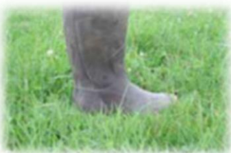
6 cm herbomètre