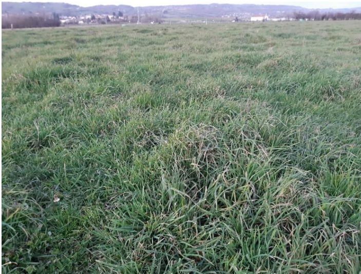
Pâturage du Lycée agricole de la Côte-St-André très développés, dernière pâturage en octobre 2022.

Les pâtures de féтуque ou dactyle dans les zones précoces présentent un développement important (jusqu'à 30 cm). Cela entraîne le développement en touffe des plantes et compromet la qualité du pâturage au printemps. Il faut éliminer cette végétation par le pâturage des génisses, voire des vaches laitières, ou broyer. Si la fauche est envisagée, elle interviendra tardivement (pas avant un mois) et retardera la mise à l'herbe.