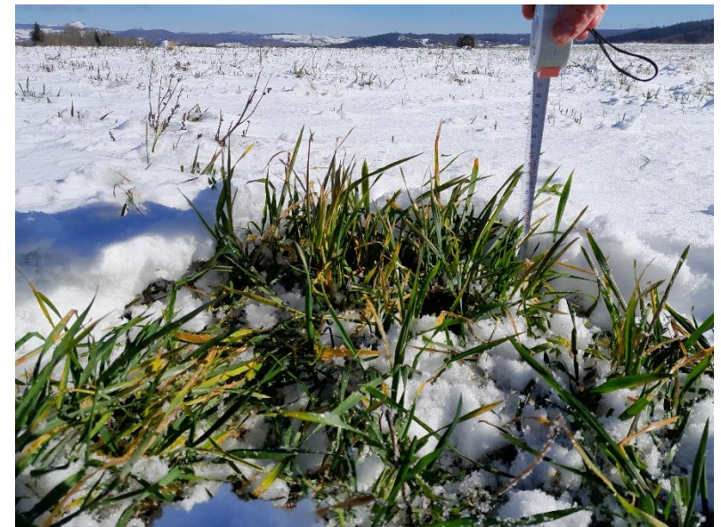
Prairie temporaire sous la neige en Montagne Ardéchoise. Beaucoup de feuilles en sénescence

Les RGI présentent parfois un développement important (30 à 40 cm). Cette biomasse peut être pâturée ou ensilée selon les situations. Des coupes ont déjà été réalisées dans les secteurs précoces (Bièvre et Nord-Isère)