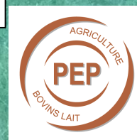
Bourg les Valence