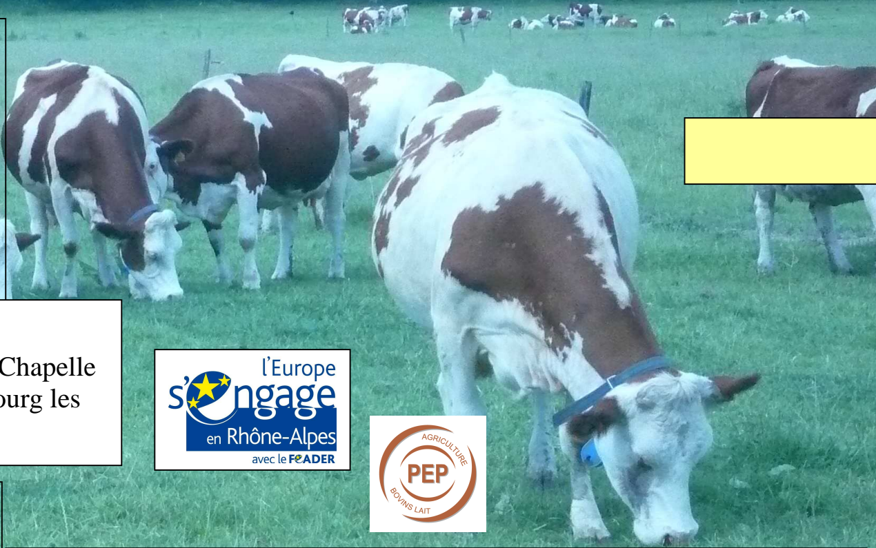
La Chapelle en Vercors, prairies naturelles et PME