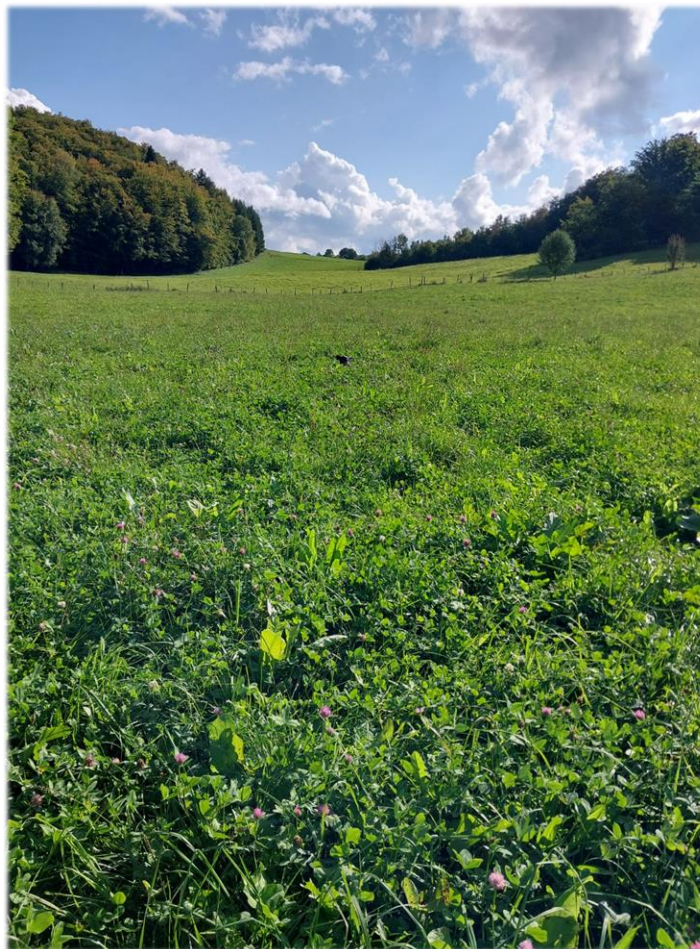
Prairie temporaire riche en trèfle dans le Vercors le 23/09/2024

👉 Afin d'assurer l'ingestion et la densité énergétique de la ration, il vaut mieux limiter le pâturage à une demi-ration au maximum en pâture uniquement en journée, voire seulement l'après-midi si l'herbe manque d'appétence . Surveiller le taux d'urée du lait qui a tendance à monter en raison d'une herbe plutôt pauvre en énergie (peu de soleil). Corriger en énergie si besoin.