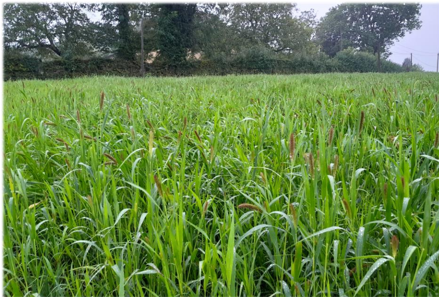
Moha dérobé semé fin-juillet derrière blé d'hiver. Au stade début épiaison le 9 septembre Récolte à prévoir dès le retour des conditions favorables

Ces fourrages de qualité moyenne sont à réserver principalement aux animaux à besoins limités : génisses, vaches allaitantes, etc.