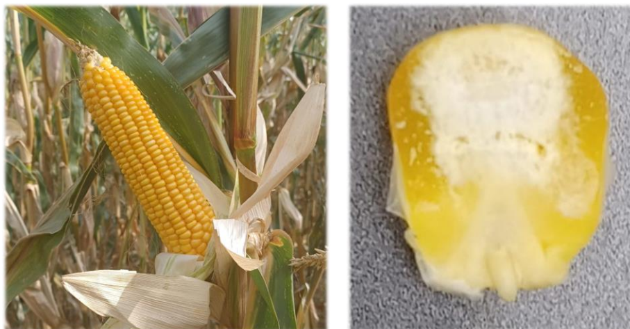
Maïs au stade pour ensilage de l'épi. Le grain présente encore la pointe laiteuse à sa base

Si le grain ne présente plus du tout de lait, il vaut mieux s'orienter vers une récolte en grain humide.