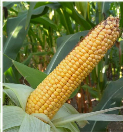
Parcelle semée le 12 mai Stade 28 % de MS le 26 août Grain à 50% laiteux

La récolte des parcelles ayant fleuries autour du 20-25 juillet (semis du 10-15 mai) commencera en fin de semaine et se poursuivra sur la première semaine de septembre. Les parcelles semées fin-mai attendront probablement le 10-15 septembre.