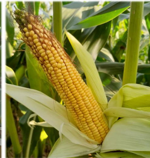
Parcelle semée le 25 mai Stade 23 % de MS le 26 août Apparition de la lentille vitreuse