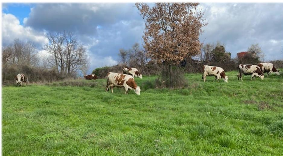
Première sortie des vaches laitières le 18 mars à Quintenas (Nord-Ardèche)

En plaine, attention à être réactif dans la gestion de son pâturage. En respectant la portance des sols, les transitions alimentaires doivent s'accélérer pour coller au mieux à la pousse de l'herbe . Les prairies riches en dactyle et féтуque doivent être privilégiées afin de limiter le développement de « touffes ».