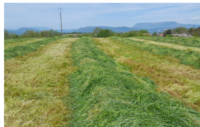
Récolte de RGI avant maïs le 4 mai dans les Terres Froides Stade dernière feuille étalée

Plaine : La très grande majorité des RGI dérobés ont été récoltés la première semaine de mai. Ceux qui restent seront fauchés à un stade trop avancé, épiaison bien passée.