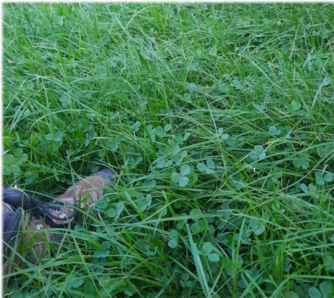
Bonne repousse dans les pâtures naturelles dans les Terres Froides la semaine dernière

Les conditions actuelles sont très propices à la croissance de l'herbe et au pâturage. Si ce mois d'octobre reste très ensoleillé et sans gelée, la pousse automnale de l'herbe pourra être importante.