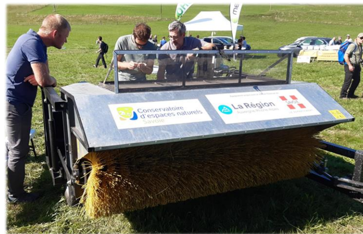
Récolteuse à graines de prairie naturelle