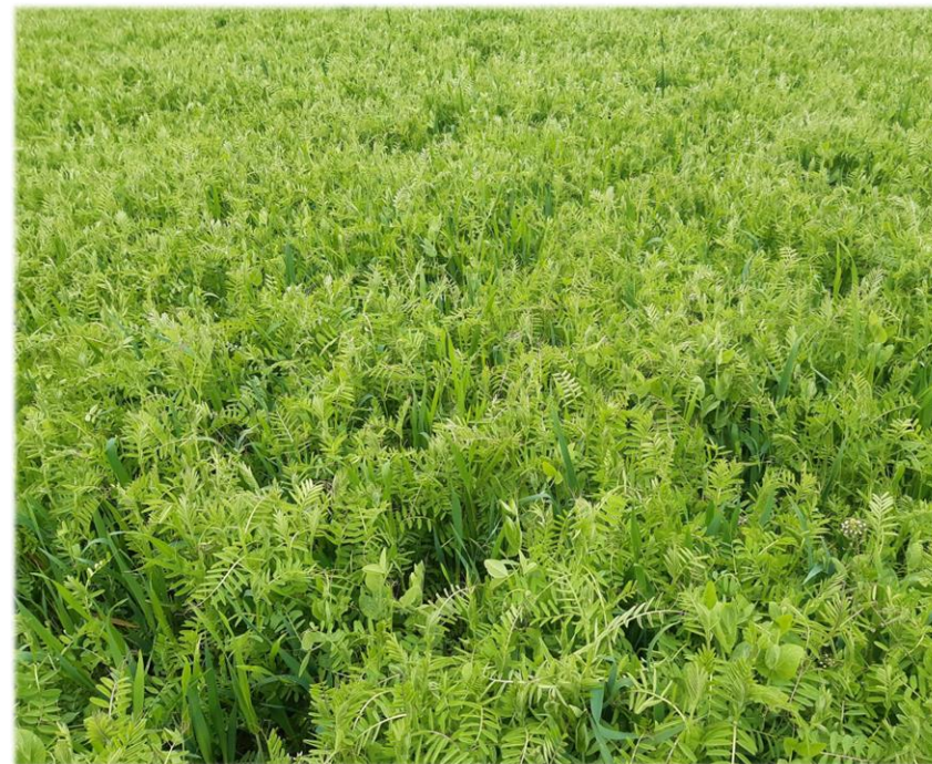
Méteil Avoine + Pois fourrager + Vesce commune le 18 avril 2023 sur le secteur St Marcellin

En cas d'implantation entre deux maïs, penser à bien décompacter la parcelle sur au moins 15 cm pour ne pas pénaliser l'enracinement du méteil (tassement fréquent lors des ensilages).