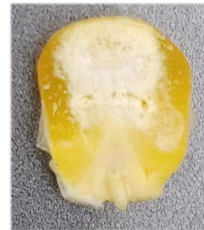
Maïs au stade pour ensilage de l'épi. Le grain présente encore la pointe laiteuse à sa base