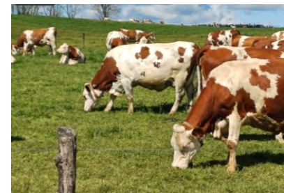
Montbéliardes en pâturage tournant dynamique à 3-5 kgMS/VL/j, hauteur entrée : 7,5 cm, hauteur de sortie visée : 5,5 cm, Monts du Lyonnais, Gravier A

Le 1 ère paddock (ou la 1 ère parcelle) de votre circuit de pâturage n'est pas forcément le 1 er à pâturer ! Les conditions météo de ces derniers jours ont exacerbé les différences d'offre en herbe pâturable entre parcelles voire entre paddocks (effets compositions prairies, conduite de pâturage 2024, fertilisation et fertilité des sols, exposition, ...). Il est important de classer dès à présent ces paddocks ou parcelles selon leur offre en herbe. Toutes vos prairies et mêmes paddocks, ne produiront pas au même moment ni sur la même durée avec la même qualité d'herbe (surtout en 2025) !