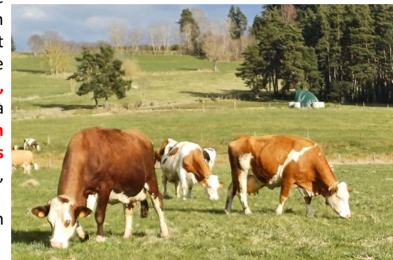
Montbéliardes et Simmental en début de pâturage, 2 à 3 kgMS ingérés/VL/j, sur prairie permanente tardive en après-midi (appétence de votre herbe), Sud Monts du Forez, Gravier A.