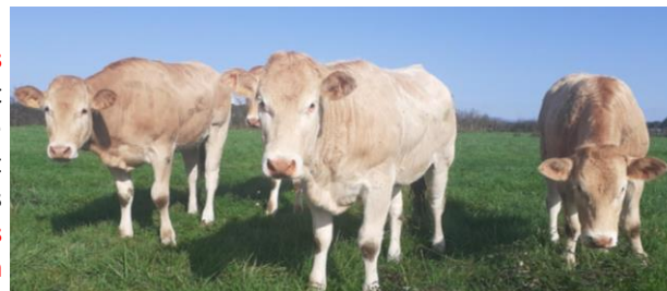
Génisses Blondes d'Aquitaine en système pâturage tournant assez dynamique. En bovins viande, le pâturage tournant rapide (voire dynamique) est la clef pour optimiser au maximum votre herbe (selon sa croissance et sa qualité alimentaire) tout en sécurisant les performances de vos animaux, dans un contexte d'aléas climatiques. Plaine du Forez, Gravier A.