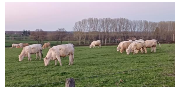
Pâturage génisses Charolaises 15 mois en pâturage continu avec fourrage complémentaire : risque de développement précoce de refus si maintien de cette pratique sur cette parcelle ces prochains jours. Plaine de Roanne, Gravier A