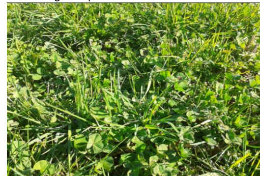
Prairie multiespèce « protéique », avec graminées non remontantes (dactyle bien maîtrisé) et une forte proportion de légumineuses agressives. Prairie idéale pour un stock sur pied en juin 2024. Monts du Lyonnais, Gravier A.