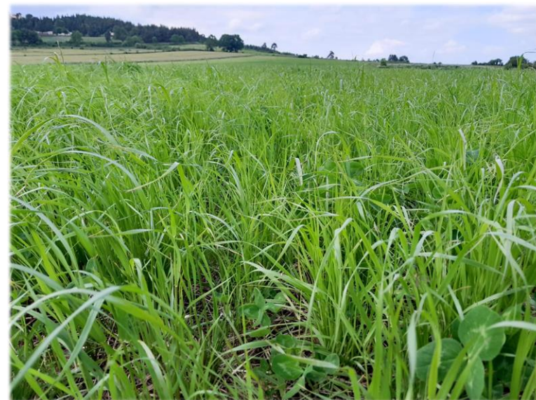
Repousses de RGH-Trèfle fauché une 1 ère fois le 25 mai en Montagne ardéchoise Dans l'idéal, sa récolte est à prévoir dans 10 -15 jours

Dans ce contexte, il est judicieux de miser sur des top fourrages en seconde coupe. L'objectif est de récolter 6 à 7 semaines maximum après la 1 ère coupe afin d'assurer la valeur alimentaire.